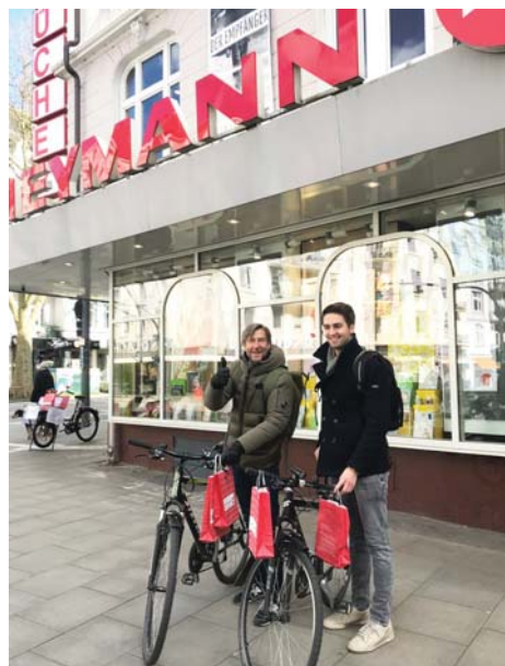
Christian Heymann und Sohn als Fahrradkuriere