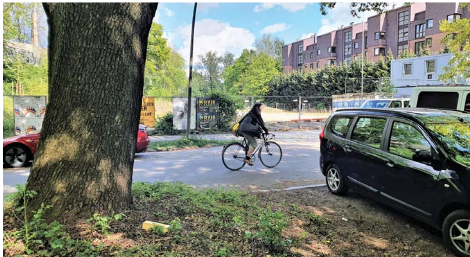
Reifen-Helms-Gelände am Salomon-Heine-Weg heute

Mehrere Nachbar*innen sorgen sich indes, dass die kostenlosen Parkplätze wg. der Baupläne auf der Strecke bleiben. Auf Nachfrage teilt das Bezirksamt mit: „Da es sich bei dem Bauplan-Entwurf um die frühzeitige (Bürger-)Beteiligung handelt, ist die Neuregelung der Situation nicht im Detail beschrieben.“ Grundsätzlich sei es aber vorgesehen, die über 200 Jahre alten Eichen vor den parkenden Autos zu schützen, sie also aus der Parkanlage herauszuhalten. „Hierzu wird es erforderlich sein,